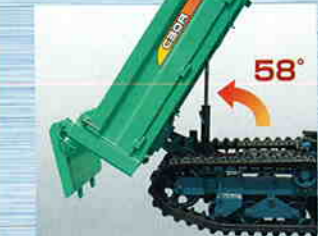
ゆどりのダンプ角と ダンプクリアランス