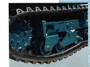
履帯が外れにくいヤンマー独自の 中つば式トラックローラ

新開発のヤンマーディーゼルエンジンは、国土交通省の排ガス2次規制はもちろん、米国のEPA排ガス2次規制、欧州(EC)排ガス2次規制に対応した、よりクリーンで静かなエンジンです。