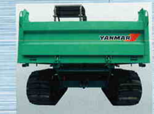
走破性にすぐれたワイドな履帯と ゆどりの地上高