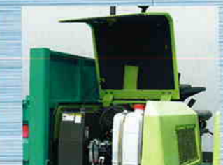
メンテナンスがしやすい フルオープンボンネット